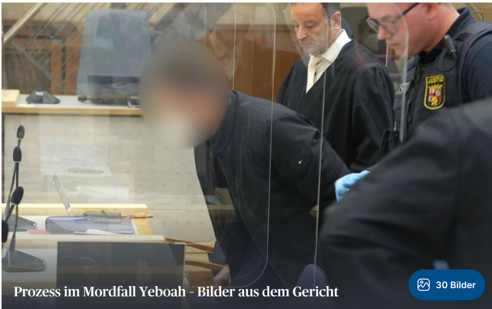
Prozess im Mordfall Yeboah - Bilder aus dem Gericht